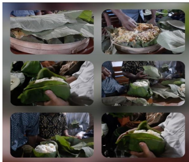
Dok. Nasi Tumpeng di balut daun jati merupakan tradisi masyarakat blora yang tidak akan di tinggalkan ( https://infopublik.id/kategori/nusantara/567374/nasi-tumpeng-dibalut-daun-jati-kearifan-lokal-blora )

Oleh karena itu, daun jati tidak sekadar dianggap sebagai produk hutan sampingan, melainkan sebagai bagian penting dalam sistem ekonomi mikro dan budaya lokal. Kontribusinya terhadap sektor kuliner tradisional menjadikannya sebagai komoditas bernilai tinggi yang perlu dilestarikan melalui pendekatan konservasi yang memperhatikan kebutuhan masyarakat pengguna secara langsung.