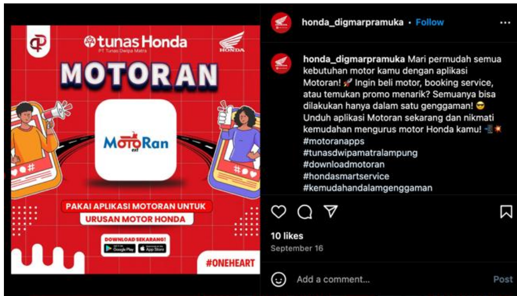
Gambar 3. Kerjasama Tunas Muda Honda dengan Pelaku Bisnis Lainnya

Ketiga, connecting. Dalam akun Instagram Instagram @honda_digmapramuka ditemukan beberapa unggahan yang menunjukkan adanya kerjasama antara Tunas Muda Honda dengan pelaku bisnis lainnya. Misalnya, kerjasama dengan MotoRan yang merupakan aplikasi tentang segala kebutuhan motor. lihat Gambar 3.