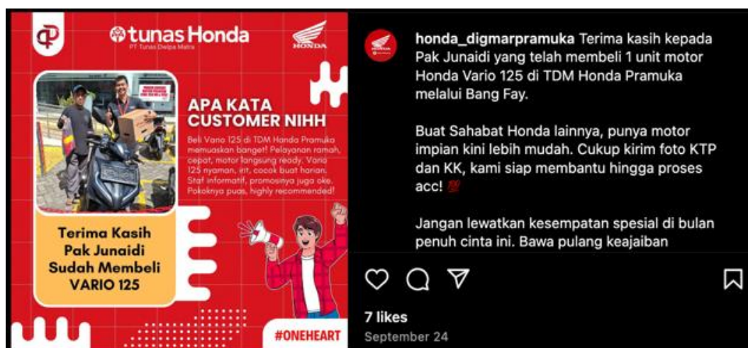
Gambar 4. Brand Image Produk Tunas Muda Honda

Salah satu indikator brand image adalah persepsi konsumen terhadap produk, seperti manfaat, harga, garansi, dan atribut produk yang dikenal dengan istilah citra produk. Brand image konsumen terhadap motor yang dijual oleh Tunas Muda Honda juga ditampilkan dalam akun Instagram @honda_digmapramuka pada gambar 4.