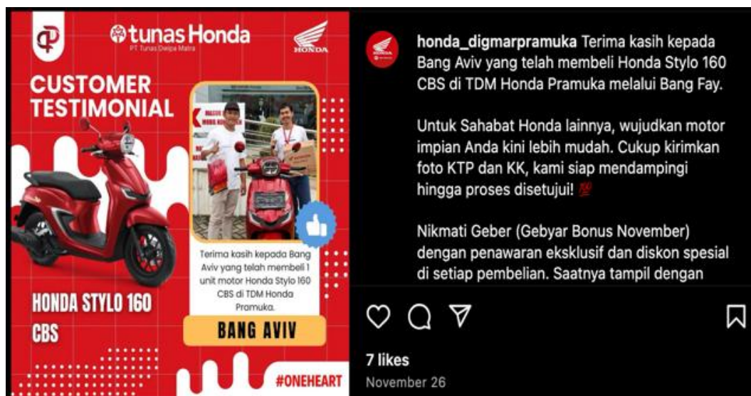
Gambar 5. Advise Seeking oleh konsumen di Tunas Honda Muda

E-WOM memberikan simultan kepada para konsumen untuk mencari informasi dan berkunjung ke media sosial terkait produk yang konsumen butuhkan. E-WOM menjadi media dengan kredibilitas sumber informasi. Tunas Honda Muda sendiri sudah menyediakan wadah bagi para konsumen untuk memberikan komentar dan opini terkait produk dan layanan yang mereka sediakan. Hal tersebut terlihat dari adanya konten-konten customer experience yang berisikan ulasan dan foto para konsumen ketika melakukan transaksi di akun Instagram @honda_digmapramuka. Konten-konten media sosial di akun @honda_digmapramuka memenuhi indikator advise seeking , yaitu motivasi konsumen untuk menulis komentar, ulasan, maupun umpan balik kepada orang lain atas produk atau layanan suatu perusahaan. Pada gambar 5 merupakan contoh dari advise seeking oleh Aviv di akun @honda_digmapramuka.