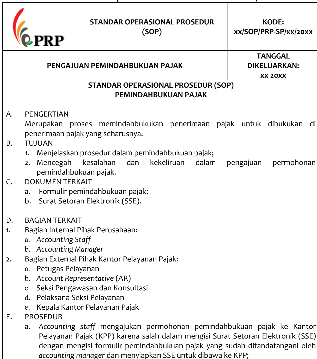
Tabel 1. Standar Operasional Prosedur Pemindahbukuan Pajak