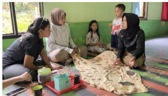
Gambar 12. Eco Print

Daya tarik budaya dan komunitas setempat di pengalaman yang melibatkan partisipasi menyorot pentingnya keikutsertaan langsung dari para wisatawan dalam berbagai aktivitas, salah satunya dengan kegiatan eco print yang merupakan cara kreatif yang berlandaskan alam dengan menggunakan daun sebagai sumber warna alami. Dalam aktivitas ini, para wisatawan ikut serta secara langsung dalam proses pembuatannya, pemahaman tentang pentingnya merawat lingkungan.