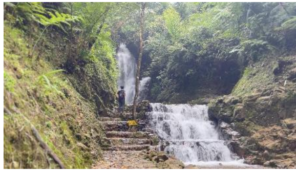
Gambar 2. Curug Kembar