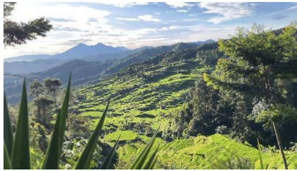
Gambar 5. Terasering

Terasering dapat menawarkan keindahan pemandangan yang menarik dan menjadi ciri visual utama kawasan Malasari. Terasering membantu mengurangi erosi dan menjaga kestabilan tanah. Adanya terasering ini menjadi salah satu daya tarik dalam ekowisata sekaligus sebagai sarana belajar tentang konservasi tradisional, sistem pertanian di daerah pegunungan, serta hubungan antara aktivitas manusia dan kelestarian lingkungan.