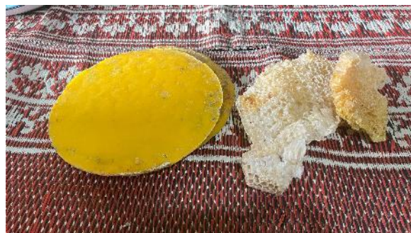
Gambar 10. Lilin Sarang Lebah