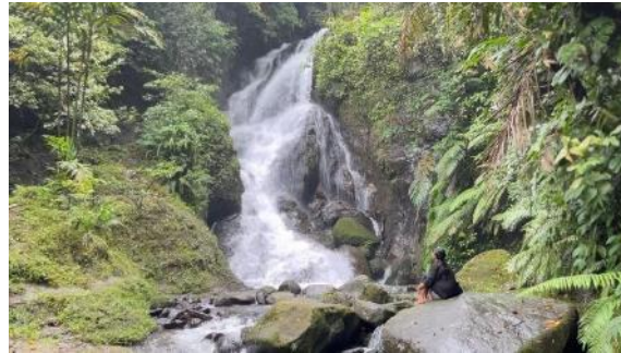
Gambar 3. Curug Sawer