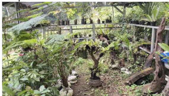
Gambar 8. Konservasi kayu

Kegiatan konservasi kayu di Desa Malasari dapat meningkatkan kesadaran tentang pentingnya pelestarian pohon dan peran hutan dalam menjaga keseimbangan lingkungan. Hal ini dapat dicapai melalui kegiatan seperti reboisasi, perawatan pohon, dan edukasi pengunjung tentang bagaimana hutan mendukung kehidupan. Konservasi kayu di Desa Malasari dilakukan dengan bibit pohon endemik yaitu rasamala, puspa, pasang, ki sireum, salam, huru, saninten, ganitri, mahoni, durian, dan kopi arabika.