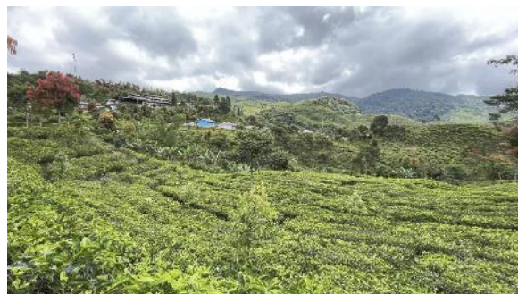
Gambar 1. Kebun Teh

Perkebunan Teh di Desa Wisata Malasari bagian dari lanskap agraria yang mendominasi, khususnya terletak di zona dataran tinggi kawasan Taman Nasional Gunung Halimun Salak (TNGHS). Perkebunan teh Malasari tersebar di beberapa kampung seperti Citalahab, Nirmala, dan sekitarnya. Ketinggian kebun teh Malasari mencapai 600-1.200 mdpl dengan kondisi suhu sejuk dan curah hujan tinggi.