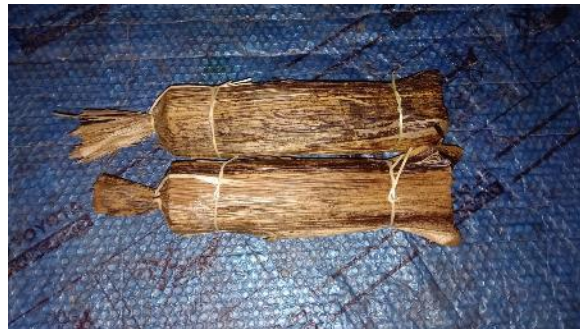
Gambar 9. Gula Aren

Produksi kopi, gula aren, menangkap tutut, dan madu merupakan bagian dari daya tarik wisata di Desa Malasari yang menunjukkan aktivitas ekonomi dan kearifan lokal dalam pemanfaatan sumber daya alam secara berkelanjutan. Wisatawan dapat terlibat dalam berbagai kegiatan seperti mengamati proses pembuatan, berpartisipasi dalam kegiatan praktik langsung, dan berinteraksi dengan penduduk setempat. Hal ini menyoroti pentingnya nilai ekonomi, budaya, dan interaksi antar manusia dan lingkungan bagi para pengunjung.