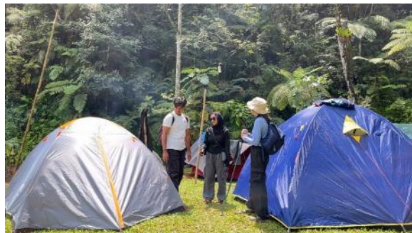
Gambar 6. Camping Ground

Camping ground di Desa Malasari terletak di Kampung Citalahab Central. Camping ground ini menawarkan pengalaman unik untuk menginap di lingkungan alami di dominasi hutan dan pegunungan. Berdasarkan pengalaman unik tersebut, camping ground dapat dikategorikan sebagai atraksi yang tergabung dalam alam, edukasi, budaya, dan partisipasi. Pendekatan ini sesuai dengan konsep ekowisata dan community-based tourism , karena dapat menghasilkan manfaat ekonomi bagi masyarakat.