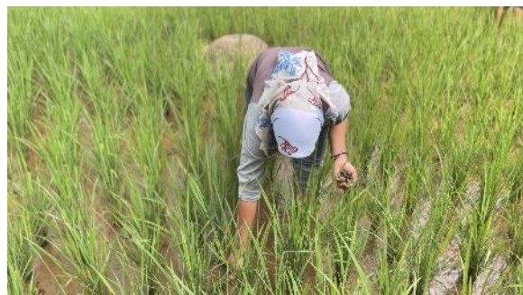
Gambar 11. Penangkapan Tutut